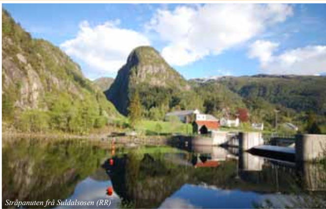
Stråpanuten frå Suldalsosen (RR)