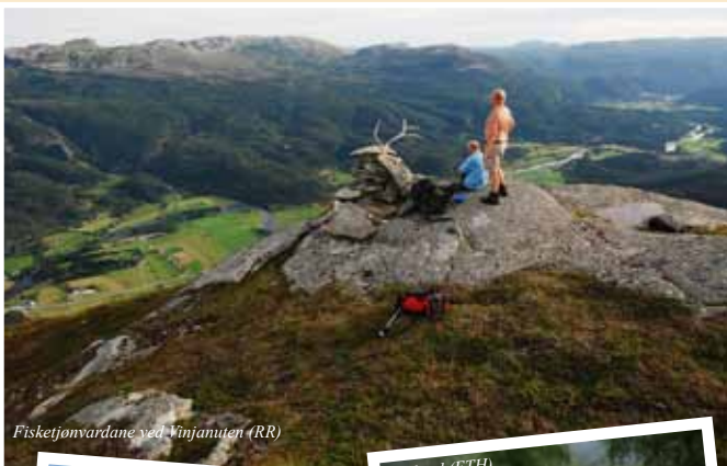
Fiskefjonnardane ved Vinjanuten (RR)